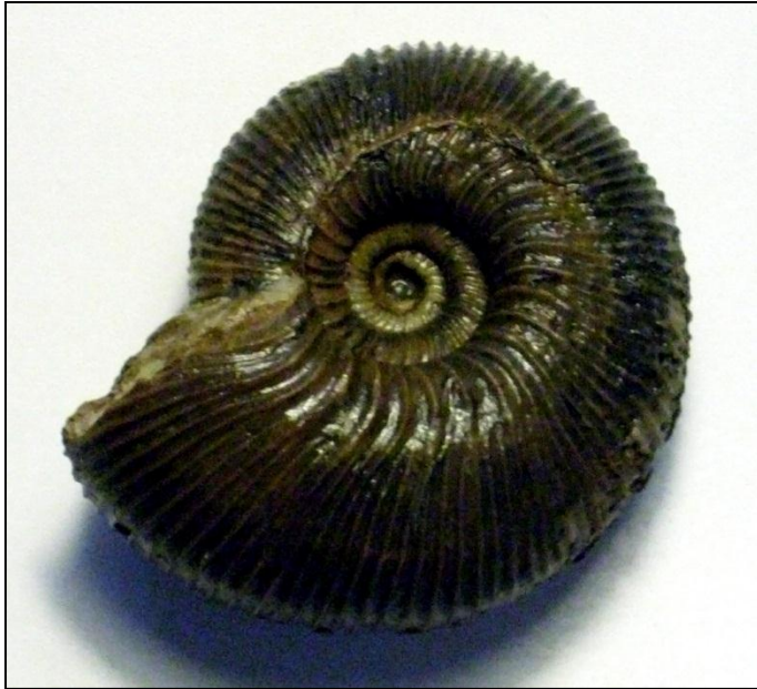
Kepplerites gowerianus SOWERBY Ø 60 mm, gefunden oberhalb der koenigi Zone Präp. u. Bild Arno Garbe