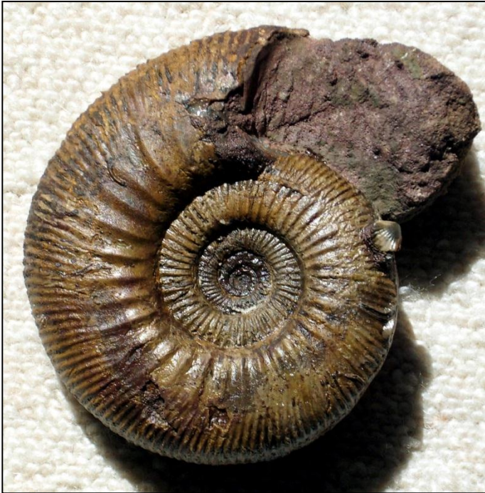
Homoeplanulites sp, Ø 115 mm gefunden in der herveyi Zone Präp. u. Bild Arno Garbe