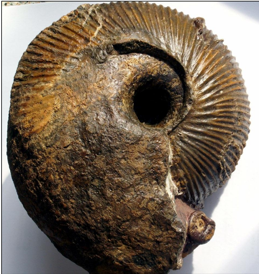
Macrocephalites macrocephalus SCHLOTHEIM Ø 175 mm Präp. u. Foto Arno Garbe

Nachfolgend ein kleiner Querschnitt der gefundenen Fossilien