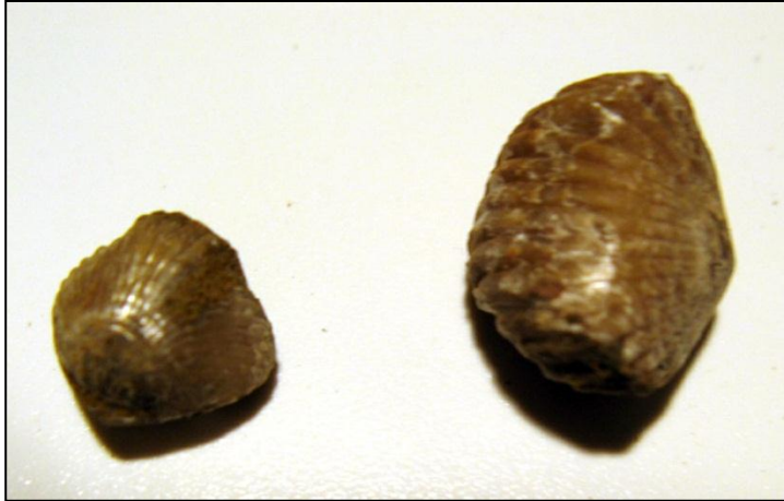
Rhynchonella sp. 10 u. 15 mm Slg. Paul