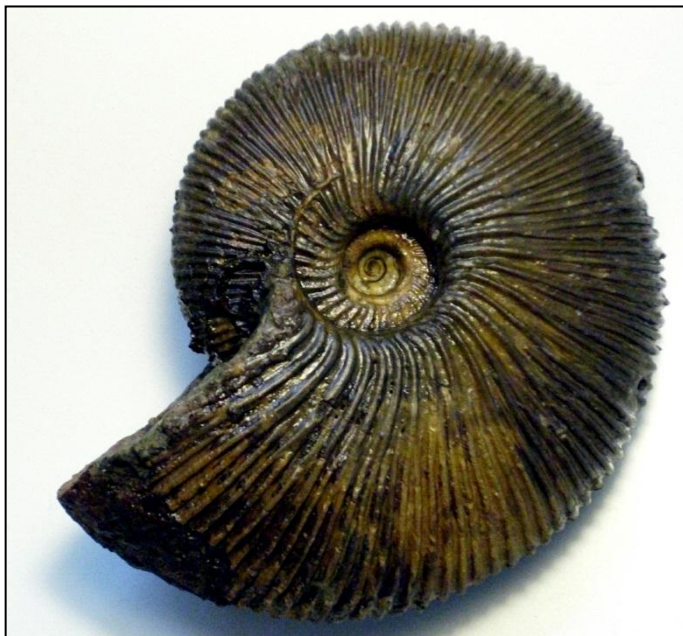
Macrocephalites cf. hoyeri Ø 80 mm Herveyi-Zone Präp. u. Bild Arno Garbe