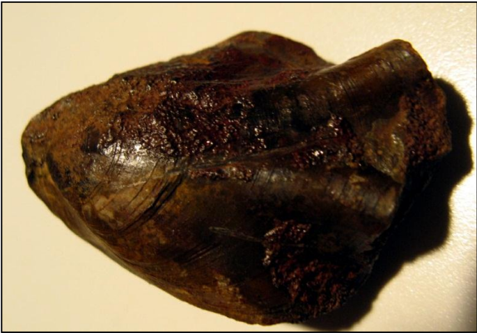
Terebratula sp. 50 mm Slg. Paul