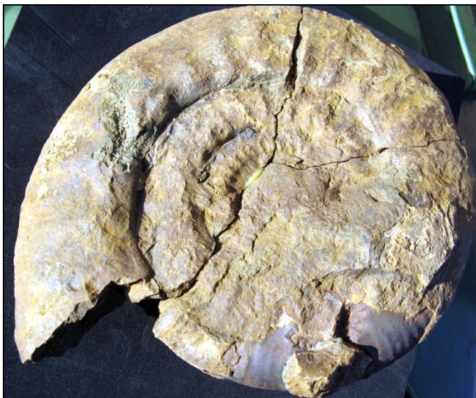
Choffatia cf. unpräg. Ø 200mm Slg. Paul