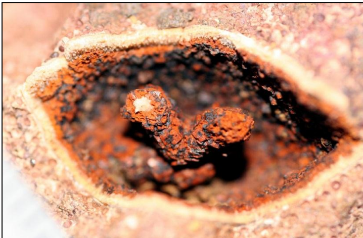
Armgerüste von Brachiopoden Bildbreite oben 20 mm unten 15mm

Zur Zeit wird eine Bestandsaufnahme der einzelnen gefundenen Fossilien gemacht und die Präparation wird auch noch einige Zeit in Anspruch nehmen.