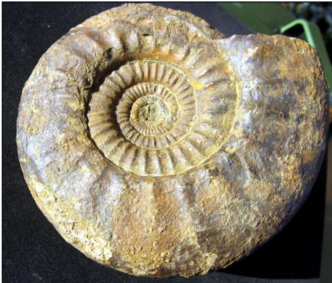
Choffatia sp. unpräg. Ø110 mm Slg. Paul