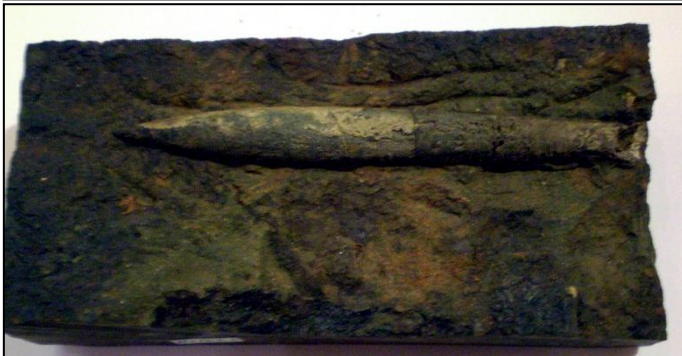
Noch nicht näher bestimmte Belemniten. Gemeinsam ist ihnen die einseitige Furche und die Verjüngung zum Phragmokon oben 40 mm unten ca.140 mm Schicht 4