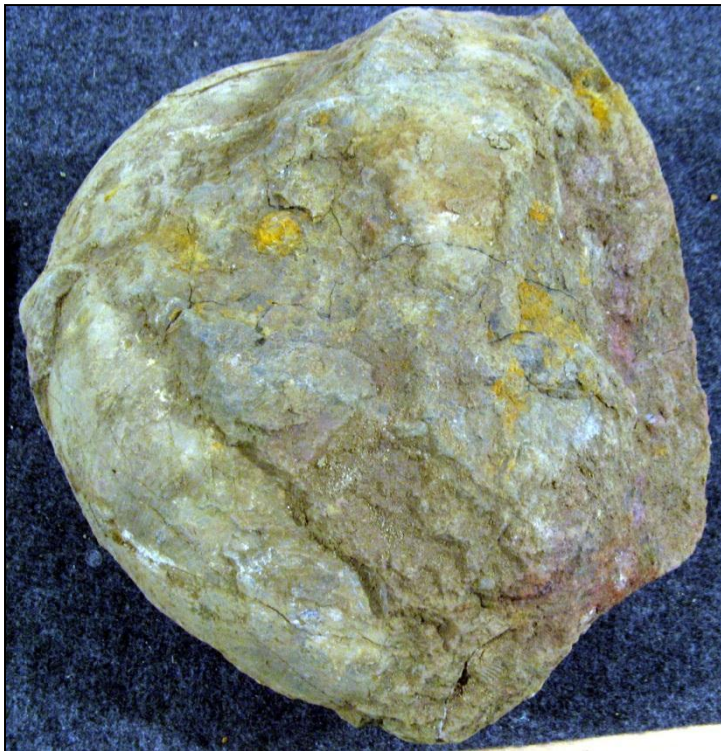
Hier möchte noch ein Ammonit präpariert werden. Vermutl. Macrocephalites verus Ø 320 mm Slg. Paul