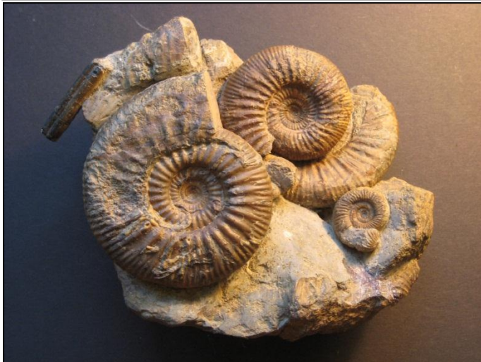
Gruppe von Homeoplanuliten Präp. u. Bild Henry Härtinger