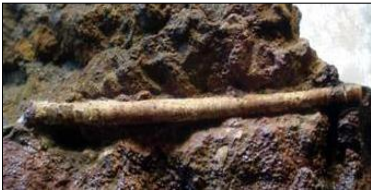
Heteromorpher Ammonit Paracuariceras acuforme DIETL Länge ca. 30mm Slg. Kierst