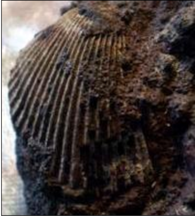
unbest. Muschel Pecte? 20 mm Slg. Paul