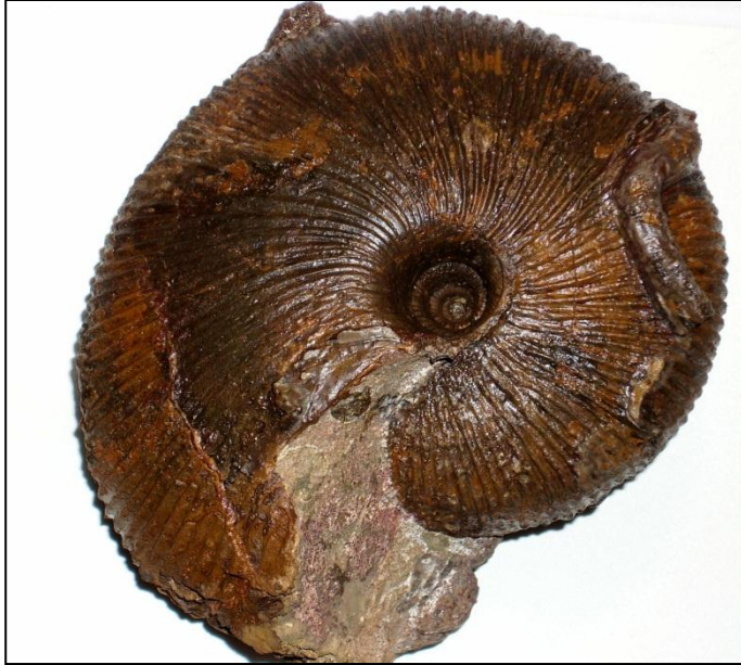
Macrocephalites verus BUCKMANN Ø 130 mm Präp. u. Bild Arno Garbe