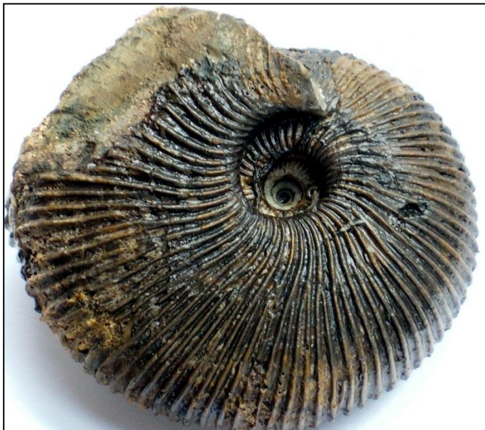
Macrocephalites cf. hoyeri Ø 65 mm Herveyi-Zone Präp. u. Bild Arno Garbe