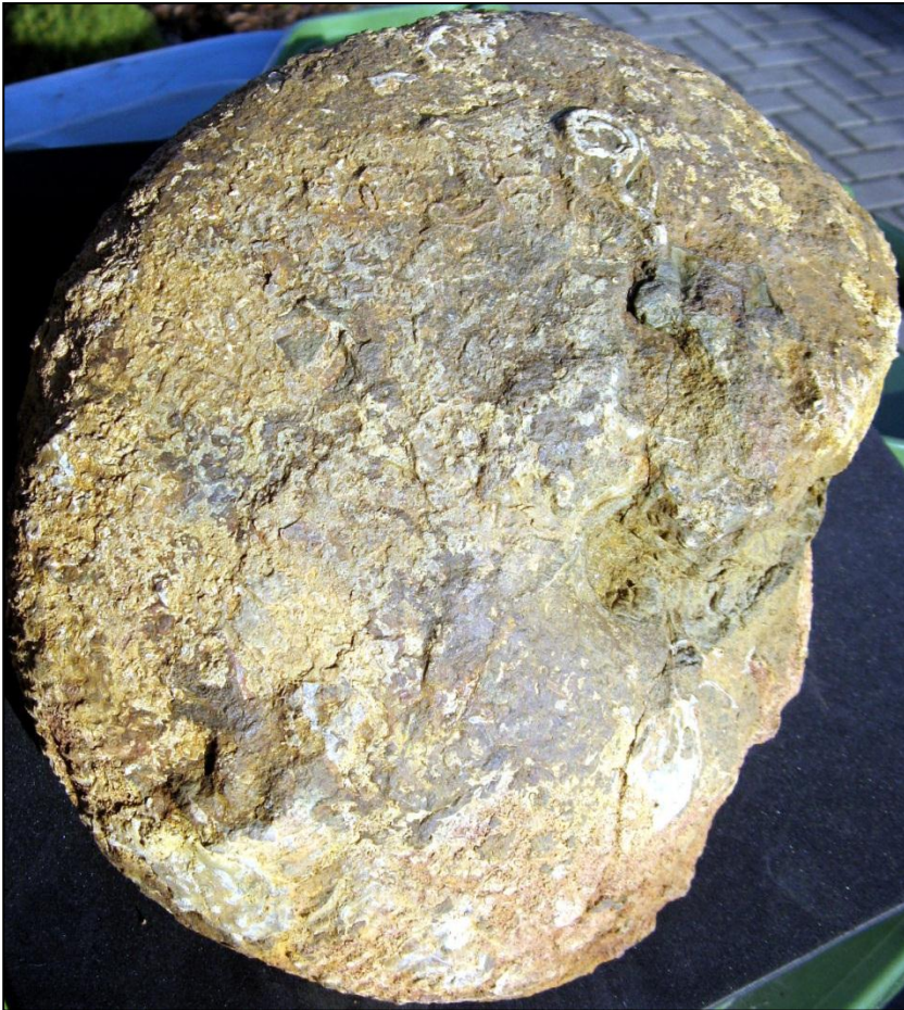
Macrocephalites verus BUCKMANN Ø 200 mm unpräp., Slg. Paul