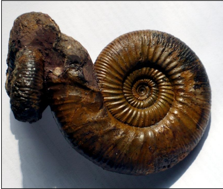
Grossouvria sp. Ø 80 mm Gefunden in der koenigi Zone Präp. u. Bild Arno Garbe