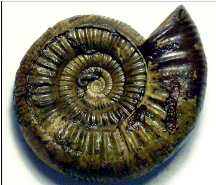
Choffatia sp Ø 65 mm Präp. u. Bild Arno Garbe