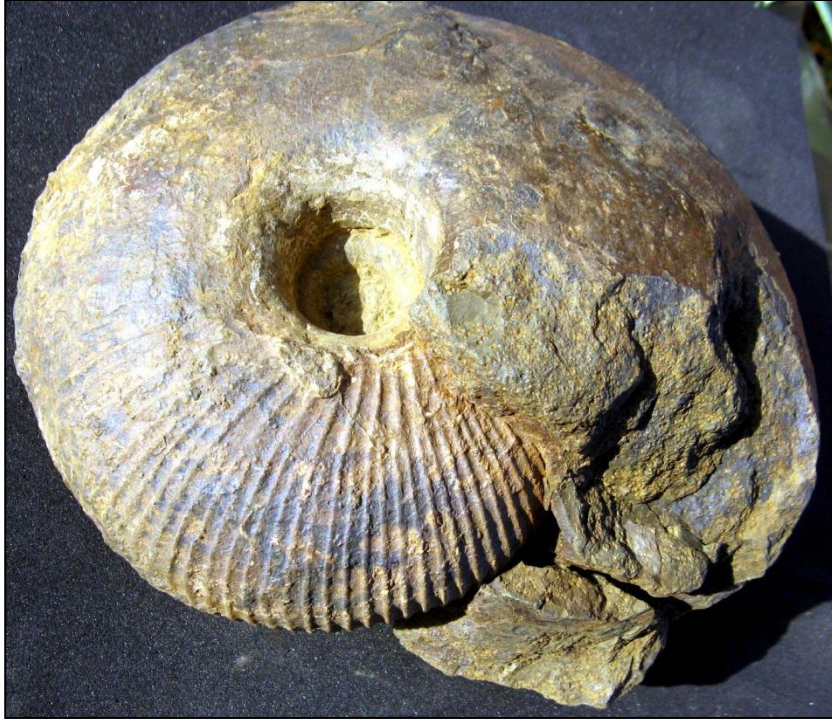
Macrocephalites verus BUCKMANN Ø140 mm anpräp., Slg. Paul