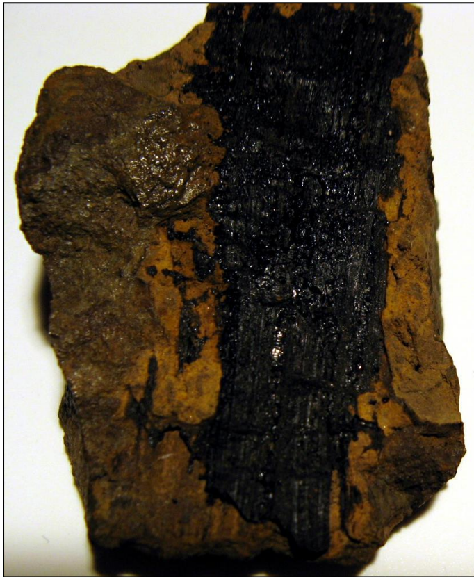
gagatisiertes Holz Schicht 4 Koenigi-Zone ca. 40 mm