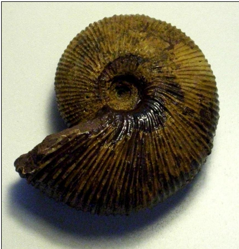
Macrocephalites cf.. macrocephalus SCHLOTHEIM Ø 60 mm Präp. u. Bild Arno Garbe