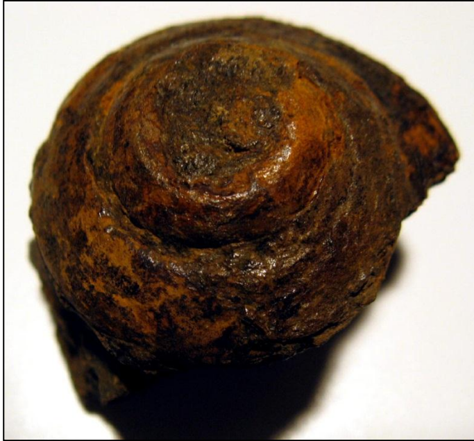
Pleurotomaria, schwer bestimmbar, da nur in Steinkernerhaltung vorliegend, Ø ca. 30mm Pleurotomarien wurden häufiger gefunden. Slg. Paul