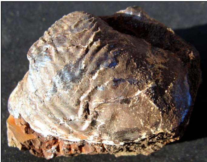
Goniomya angulifera SOWERBY 30 mm Slg. Paul