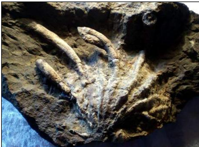
Ctenostreon pectiniformis SCHLOTHEIM ca. 70mm Slg. Kierst