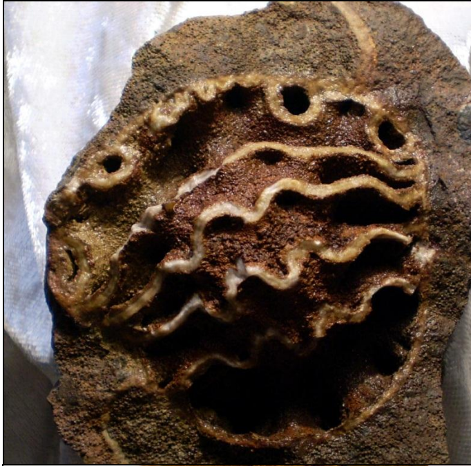
quergebrochener Bullatimorphites Bildbreite ca. 50 mm Slg. Kierst