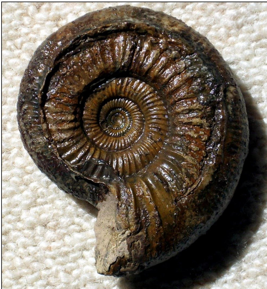
Indosphinctes cf. (Makroconch) Ø 80 mm Ob. koenigi Zone, Ton-Horizont Präp. u. Bild Arno Garbe