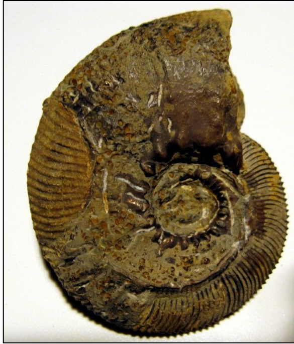
Kosmoceras jason REINECKE, D'ORBIGNY Slg. Paul anpräg. Ø 80 mm