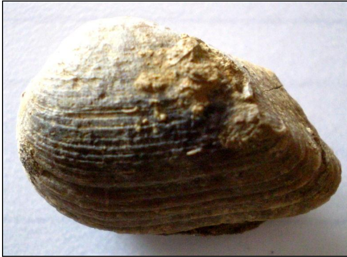
Mactromya concentrica MÜNSTER ca. 40 mm Slg. Kierst