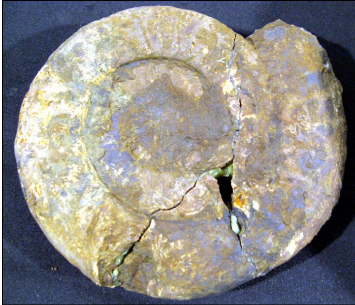
Choffatia sp. unpräp. Ø160 mm Slg. Paul