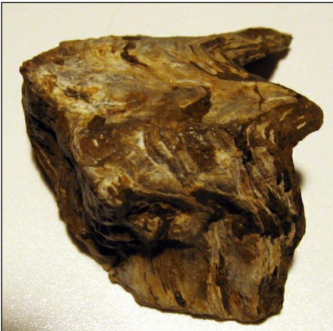
Lopha sp. ca. 50mm Slg. Paul