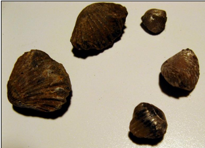
Rhynchonella sp. 10-20 mm Slg. Paul