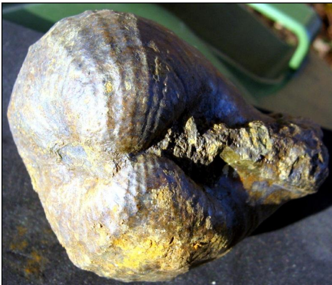
Pholadomya murchisoni GOLDFUSS ca. 50 mm sehr häufig, jedoch teilw. stark verdrückt