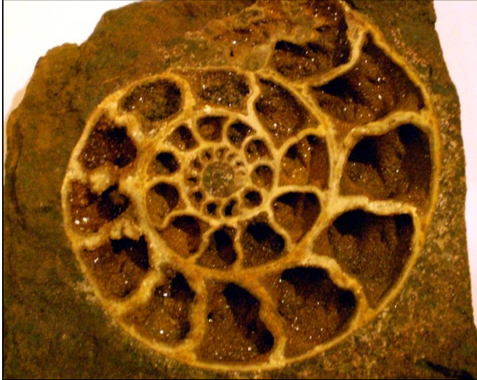
aus vielen nicht präparierbaren Ammoniten wurden Medianschliffe erstellt Ø ca. 100 mm Slg. Kierst