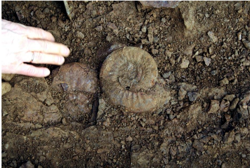
Die Ammoniten kamen teils nesterweise vor

Die Schicht 2 war sehr stark bankig ausgebildet. Die Ammoniten waren hier seltener vertreten, obwohl hier sehr schöne Bullatomorphiten gefunden wurden. Das Zerschlagen der einzelnen Blöcke des bergfrischen Materials gestaltete sich sehr schwierig, da es sehr zäh war. Die Kleidung färbte sich dann auch hierbei oft in einem kräftigen Rotbraun, zum Ärger der lieben Ehefrauen, die mit der Reinigung Probleme hatten. Aus dieser Schicht kamen nesterweise ganze Brachiopodenkolonien vor. Teilweise fielen sie beim Zerschlagen - ohne sie präparieren zu müssen – frei aus dem Gestein heraus. Ein anderer Teil bestand nur aus einer dünnen Sideritschale. Im Anbruch war dann sehr schön das mit Sideritkristallen besetzte Armgerüst zu sehen. Zur Zeit stellt die Präparation des geborgenen Materials uns vor ungeahnte Herausforderungen.