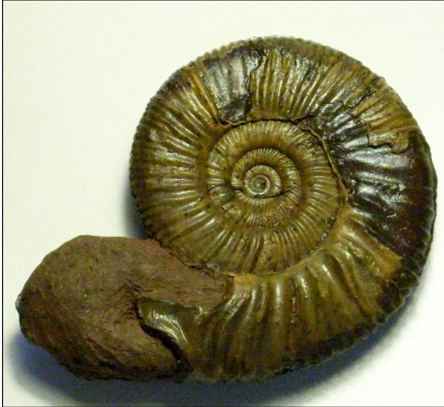
Elatmites sp. Ø 70 mm koenigi Zone Präp. u. Bild Arno Garbe