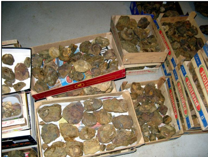
Viel unpräpariertes Material wartet noch auf die Präparation und Bestimmung.