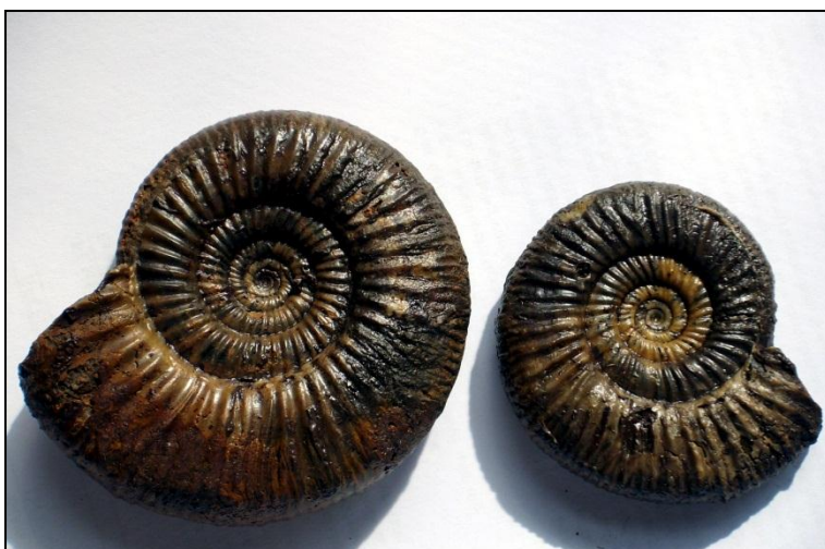
links Choffatia sp. Ø 72 mm rechts Elatmites sp. Ø 55 mm koenigi Zone Präp. u. Bild Arno Garbe